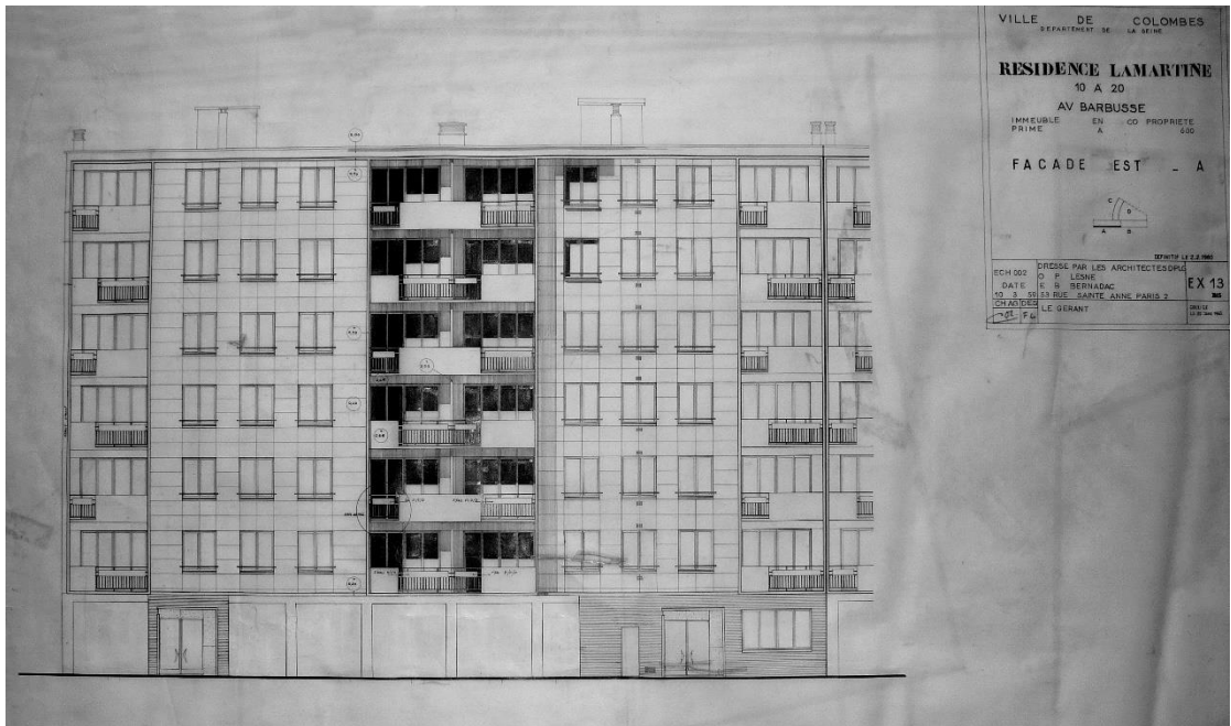
Façade est.