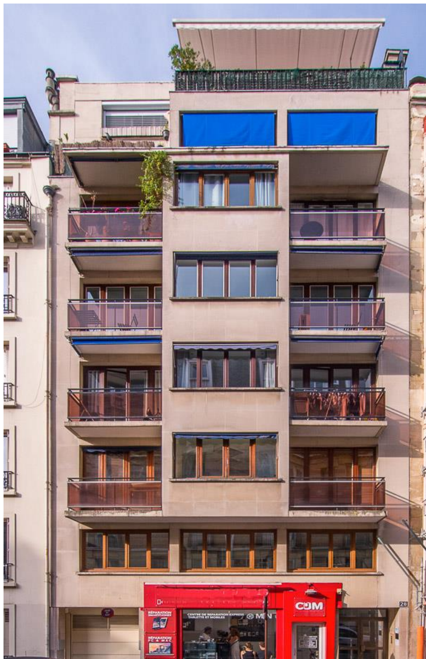
Etat 2017.