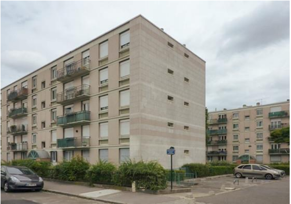
Etat 2016, après rénovation des façades et des pignons.