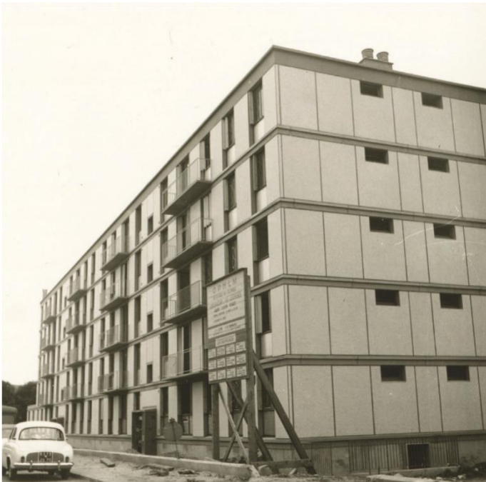
Photo de chantier.