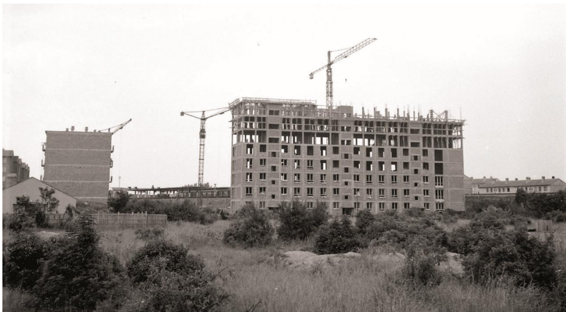
Photo de chantier.