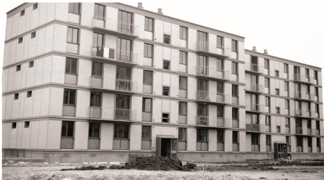
Photo de chantier.

Adresse : 78 rue du Président Kennedy (anciennement Joseph Perret), Colombes (Hauts-de-Seine).