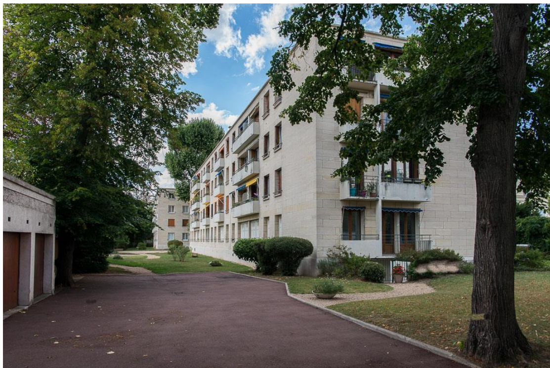
Etat 2017.