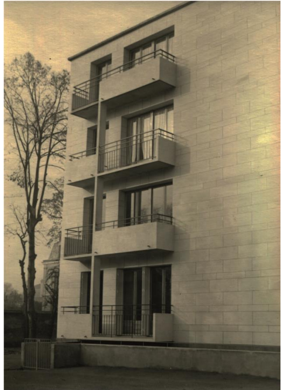
Photos d'époque.