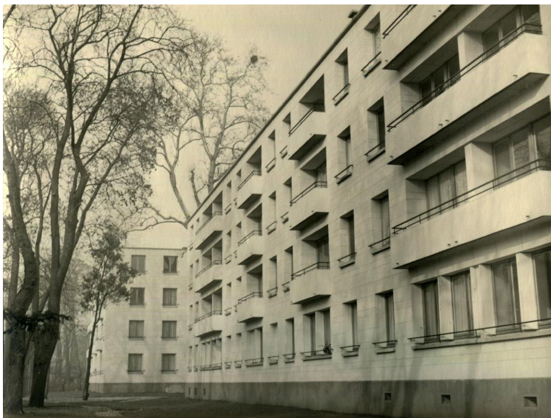
Photo d'époque.