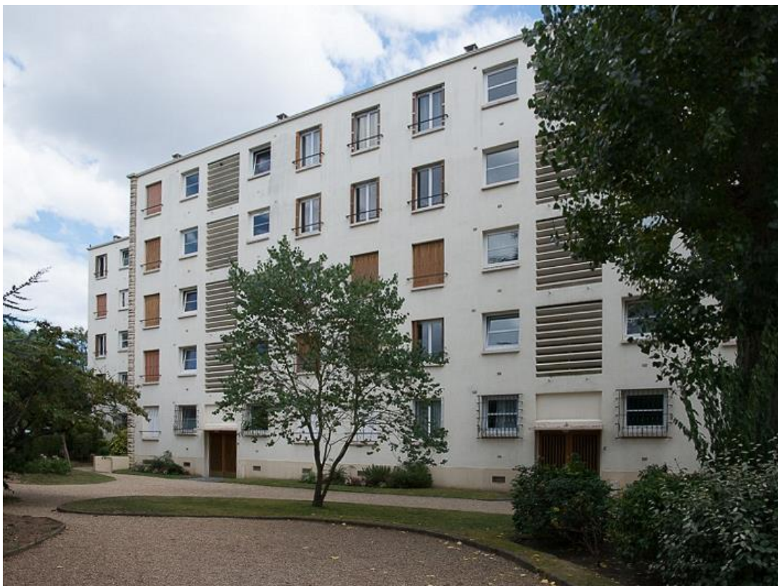
Etat 2017. Façade sur jardin.