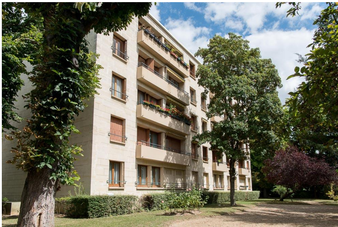
Etat 2017.