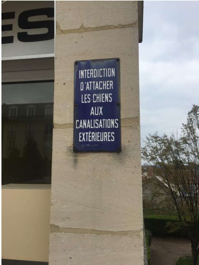
La précaution municipale.