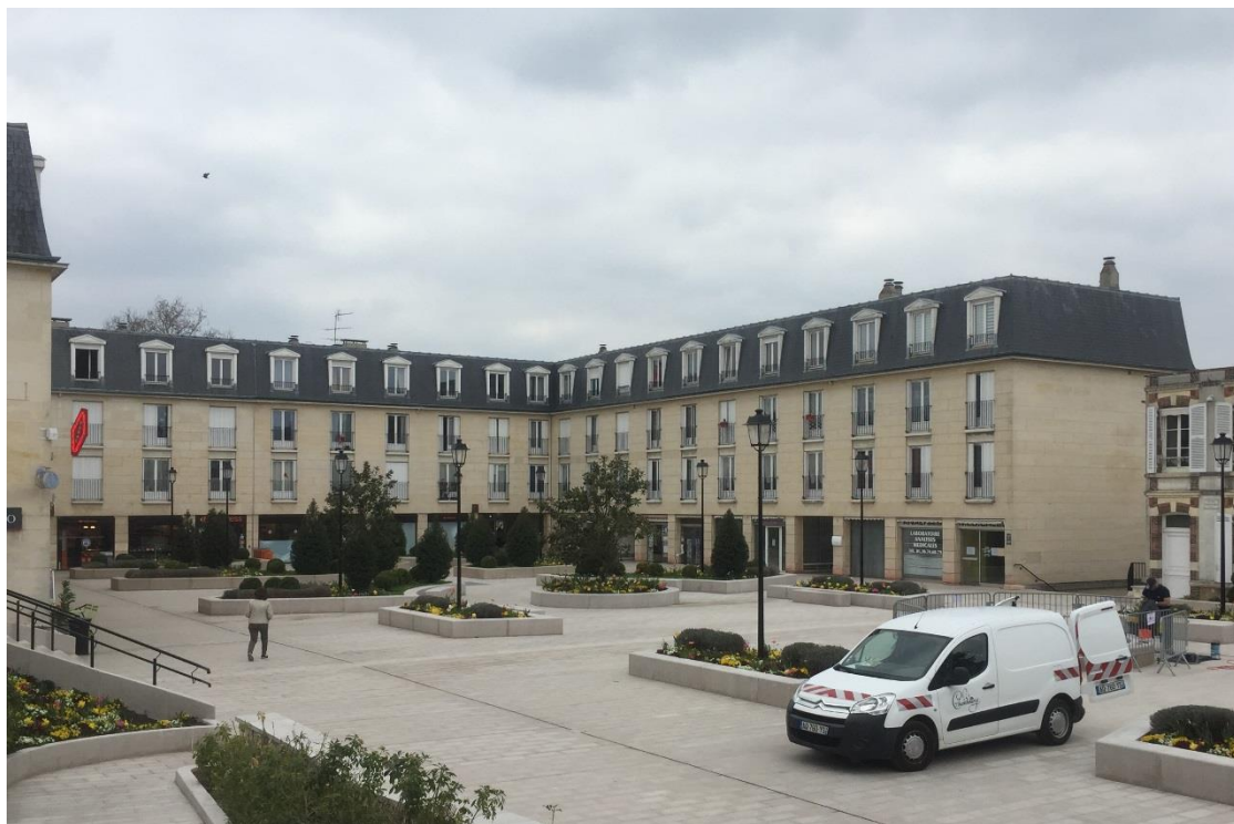
Vue de la place depuis l'église. État 2019.

Type de construction : réfection complète de la place de la Mairie avec parking en sous-sol et construction d'un auditorium.