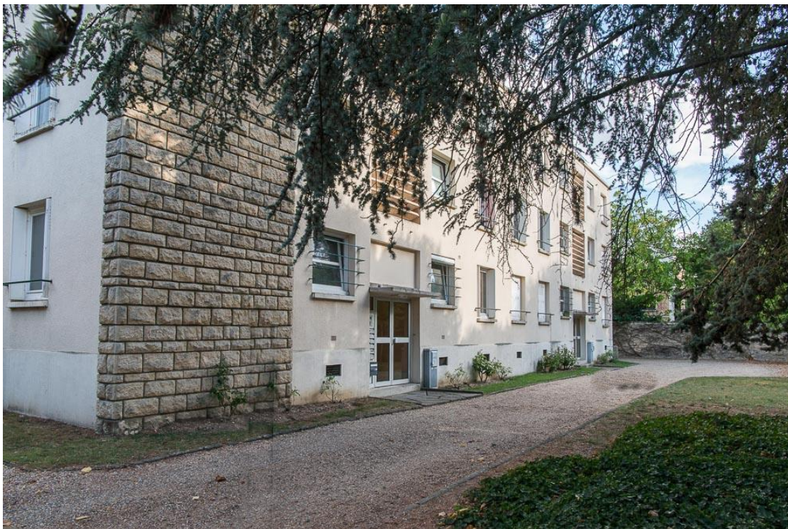
Etat 2017.